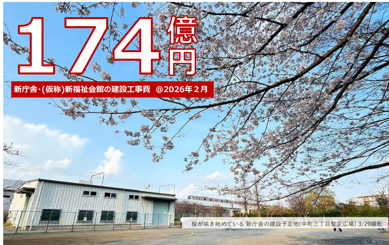
桜が咲き始めている 新庁舎の建設予定地(中町三丁目暫定広場) 3/29撮影