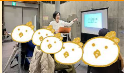
坂井の議会ホコク & なんでもフリートーク

市議会の定例会が年4回なので、最低年4回は行っています。どんなたでもお気軽にお越しください。