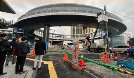
視察／四日市市 コミチよっかいち

交通のみならずヒトや賑わいも大切にした道路整備。「歩行者を第一に考える」という理念に共感