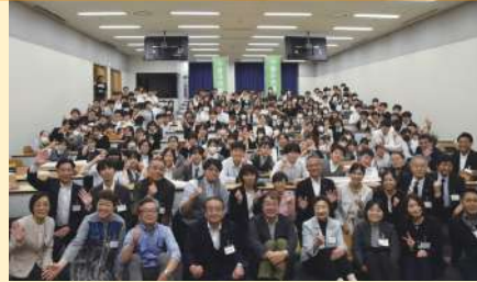
小金井市議会による出前授業

市議会の定例会が年4回なので、最低年4回は行っています。どんなたでもお気軽にお越しください。