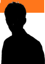
施政方針の全文は 小金井市HPで