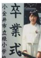
小金井市立緑小学校卒業式