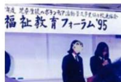
ボランティア(桜町病院ヨハネホーム)の活動報告

桜町自治会では数年前より役員を務め、消防団第五分団でも地域在住の議員として関わっています。会員であるけやき通り商店会から推薦をいただきました。