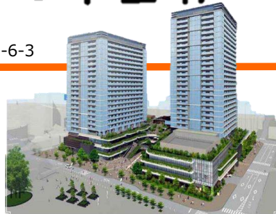
(上図、下図：武蔵小金井駅南口第2地区市街地再開発組合HPより)