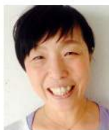
鎌仲ひとみ (映画監督)