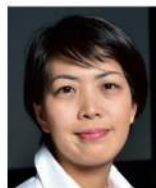
はなぶさ 瀬瀬あや (映画監督)